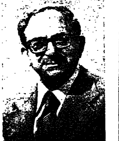
البنية على ١٤٨

اما بالنسبة للنزاع العربي - الاسرائيلي فقد لعبت ادارة الرئيس كارتر ، بل ولعب الرئيس نفسه شخصيا دورا كبيرا في سبيل نضوية هذا النزاع ، وحقق في هذا السبيل ، باسم بلاده ، انجازا تاريخيا كبيرا بالاسهام في اسقرار السلام بين اسرائيل وبين مصر ، كبرى الدول العربية ، كخطوة اولي على طريق اقرار السلام الشامل والديمقراطي في المنطقة . ونحن لا يخاف ان نشك في ان الولايات المتحدة ستعطي في نفس هذا السبيل سواء تولت زمام الحكم فيها ادارة ديموقراطية او جمهورية . ذلك ان الحزبين الديموقراطي والجمهوري يلتقيان في نقاط كثيرة جدا ازاء سياسة الولايات المتحدة بالنسبة لهذا الجزء من العالم .